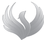
NIE NÁSILIU V RODINE A SPOLOČNOSTI

Ďakujeme všetkým dobrovoľníkom Medzinárodného spoločenského hnutia ALLATRA, ktorí sa vo svojom voľnom čase aktívne zapájajú do projektov. Tešíme sa z nových priateľstiev, nových nápadov a nových iniciatív! Pridajte sa k nám!