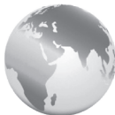
GLOBÁLNA PARTNERSKÁ DOHODA ALLATRA